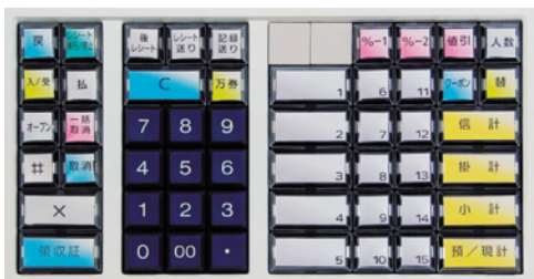
15部門タイプ(ピュアホワイト)

キーボードには使いやすく美しいユニバーサルデザインカラーを採用。おしゃれなデザインでお店の雰囲気づくりにも役立ちます。