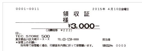
▲領収証(縮小サイズ)